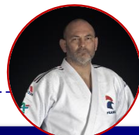
Cyril PAGES Entraîneur national en charge du secteur HP paralympique