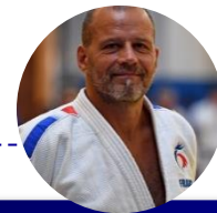
Christophe GAGLIANO Entraîneur national en charge du secteur HP paralympique